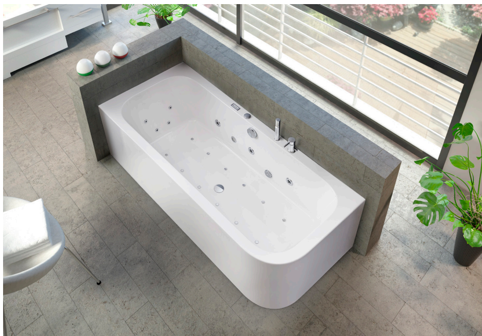
Whirlpool-Komplettsystem Spirit Modell A inkl. Wannrandarmatur S 2000